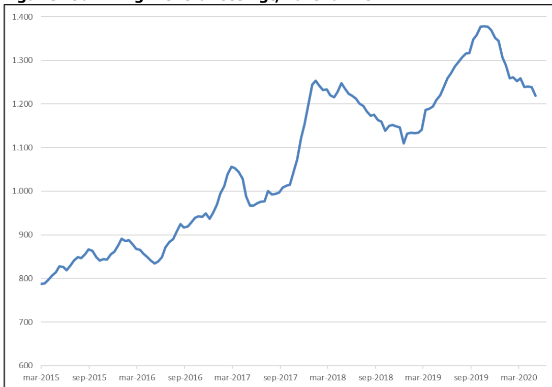
Figur 3. Udvikling i leverancesvigt, varenumre

Note: Figuren illustrerer et tre måneders glidende gennemsnit.