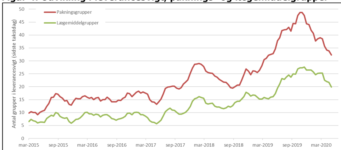
Figur 4. Udvikling i leverancesvigt, paknings- og lægemiddelgrupper

Note: Figuren illustrerer et gennemsnit for de seneste seks takstperioder.