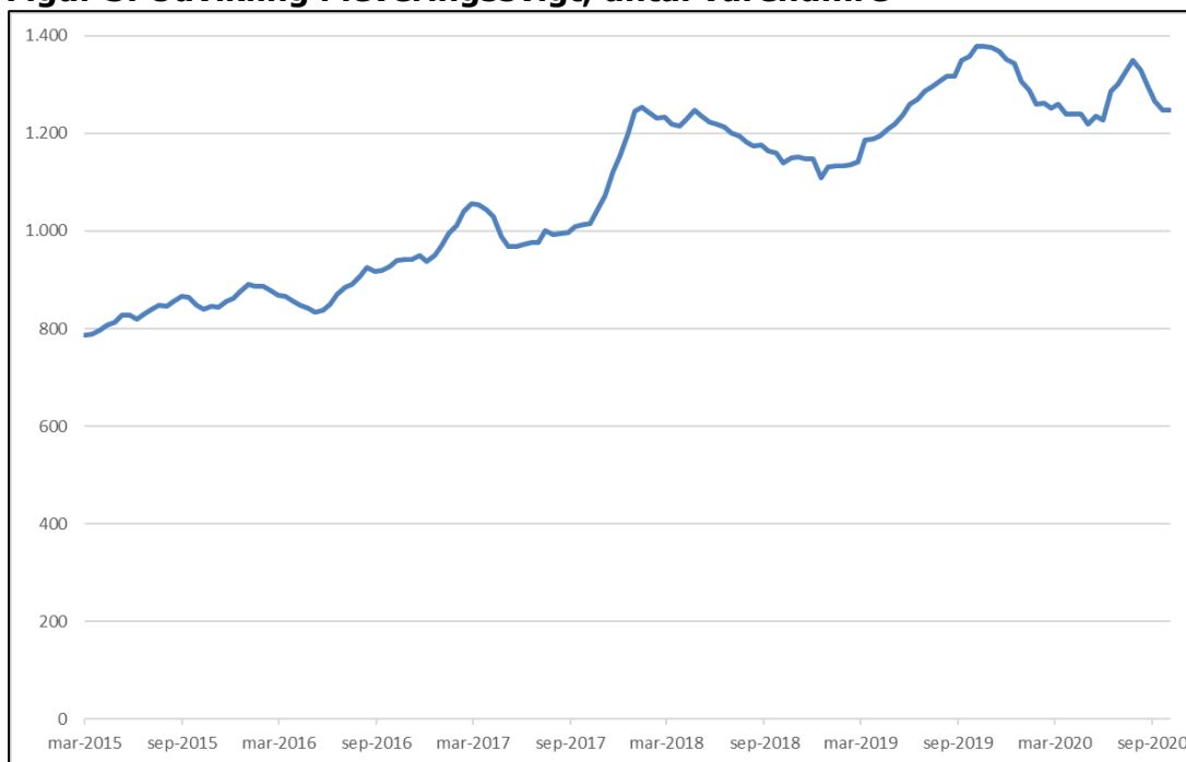
Figur 3. Udvikling i leveringsvigt, antal varenumre

Note: Figuren illustrerer et tre måneders glidende gennemsnit. Den seneste observation er fra oktober 2020.