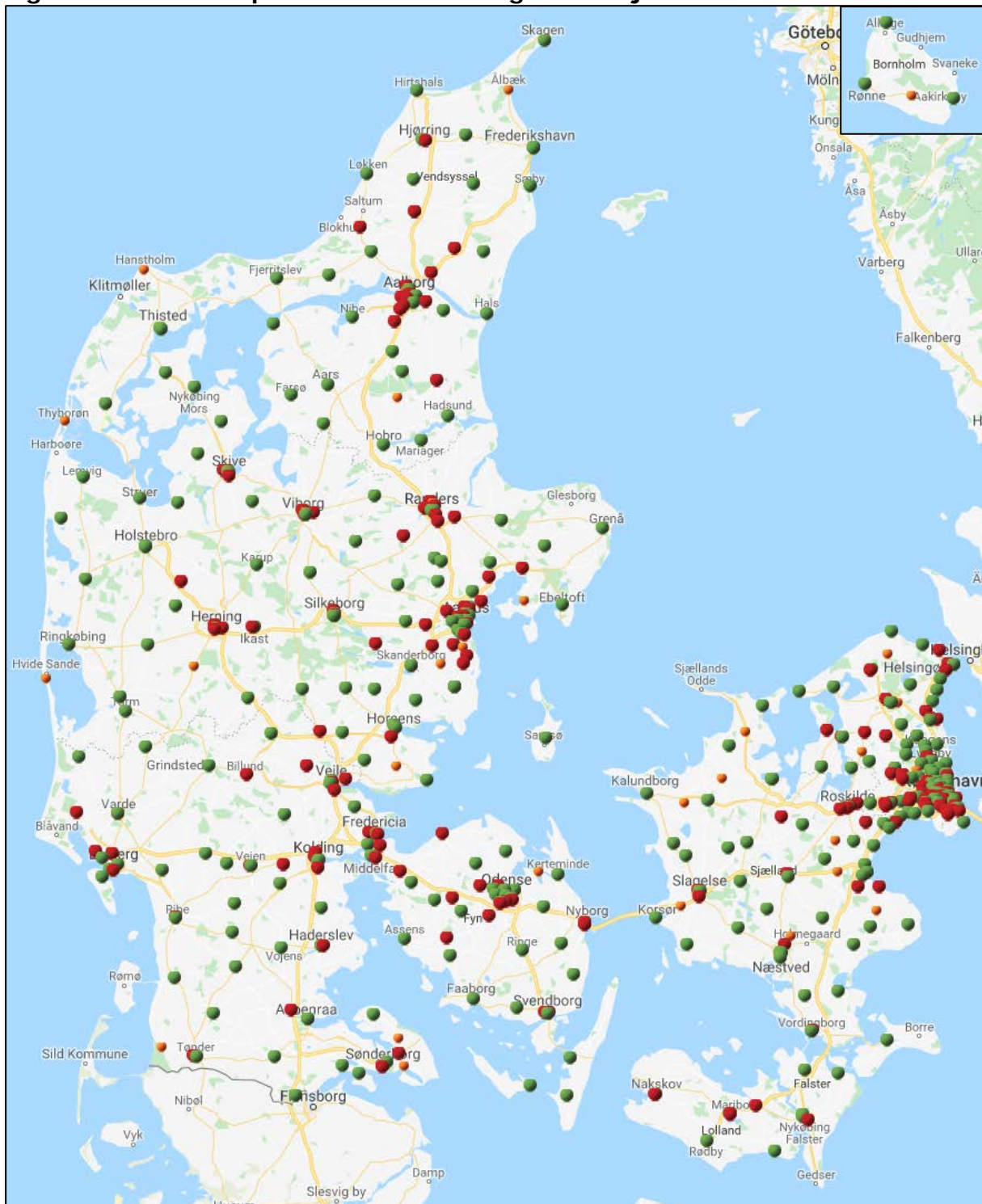
Figur 3: Kort over apoteksenheder før og efter 1. juli 2015

Kilde: Danmarks Apotekerforening. Opgjort pr. 06-12-2018