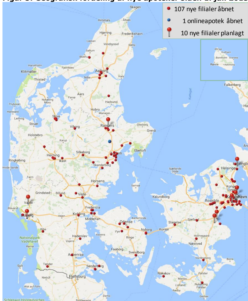
Figur 3: Geografisk fordeling af nye apoteker siden 1. juli 2015

Kilde: Danmarks Apotekerforening. Opgjort pr. 24-01-2017.