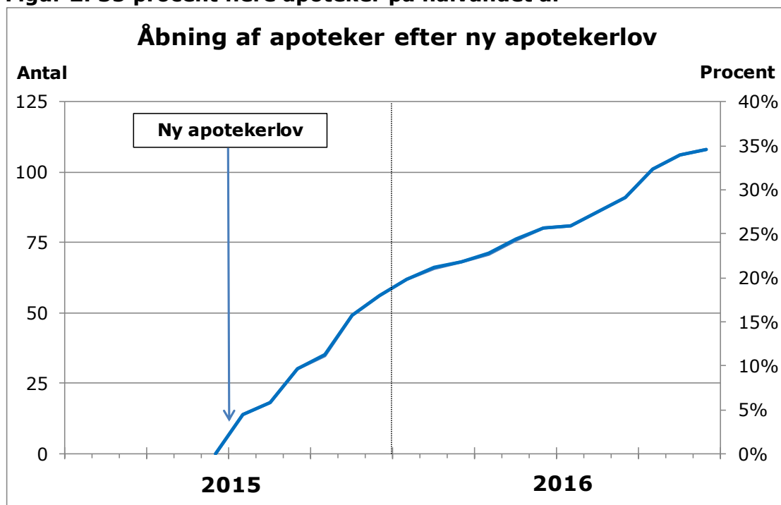
Figur 2: 35 procent flere apoteker på halvandet år

Antallet af apoteker er dermed vokset hurtigere i Danmark end efter den norske liberalisering i 2001 og den svenske i 2009. I disse lande var der 2 år efter liberaliseringen kommet 26 procent flere apoteker i Norge og 34 procent flere i Sverige.