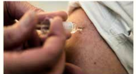
TV 2 Nyhederne, 23. oktober 2012