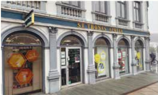
Jyllands-Posten, 9. oktober 2021

Apoteker Thomas Carls Rasmussen fra St. Thomas Apotek beroliger på vegne af flere apoteker om markant stigende antallet af vaccinerede i den seneste uge mod influenzavacciner.