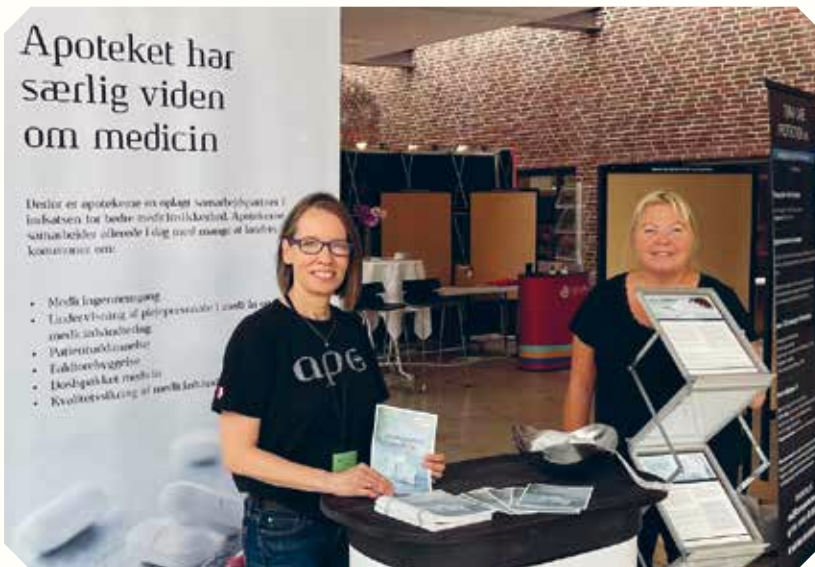
PARAT. Apotekernes kredskonsulenter stod klar til at fortælle om apotekets medicinkompetencer, da ledere fra landets botilbud var samlet til Socialt Lederforums landsmøde på Hotel Nyborg Strand i slutningen af august.